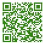
Court central - 3 " fiche de postes "