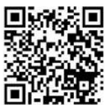
Court central - 1 " fiche de postes "