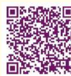
Résolution - CSEC " fiche de postes "