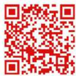
Court central - 2 " fiche de postes "